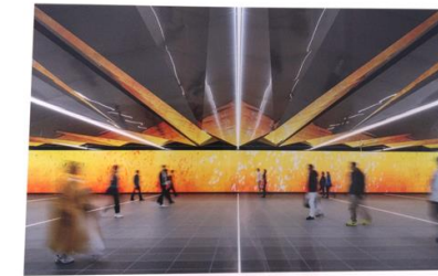
2025年照明施設賞 受賞 一般社団法人 照明学会 Osaka Metro 中央線 夢洲駅の照明